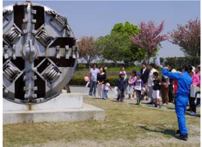
げすいどう ほった てんじ 下水道を掘ったシールドマシンの展示