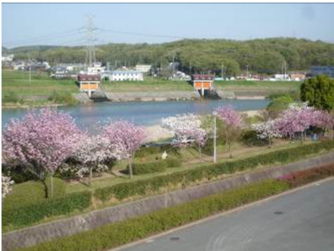
まんかい かこがわていぼう 満開のやえざくら (加古川堤防)