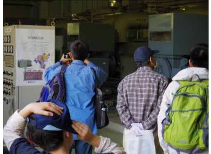
じっさい みずしより しせつ あんない 実際に水処理をする施設を案内