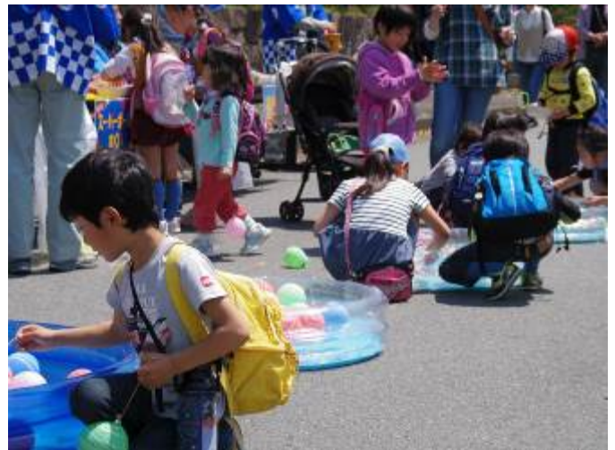
ヨーヨー釣り、ふうせん プレゼント、ほか