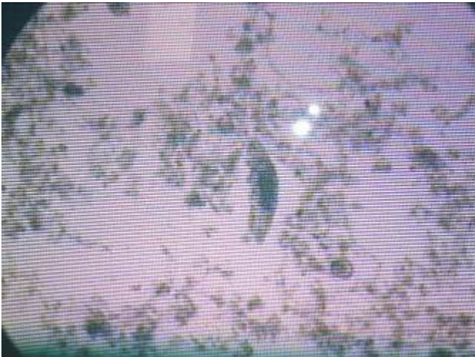
みず びせいぶつ かんさつ 水をきれいにする微生物の観察