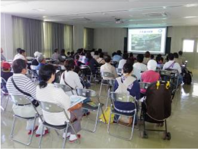
みずしより つかいかた せつめい 水処理のしくみや使い方を説明