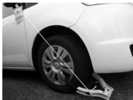
タイヤロック見本

換価処分(債権取立・不動産公売) 債権は原則即時で取り立てます。不動産や動産については市で売却し、滞納している税に充てます。